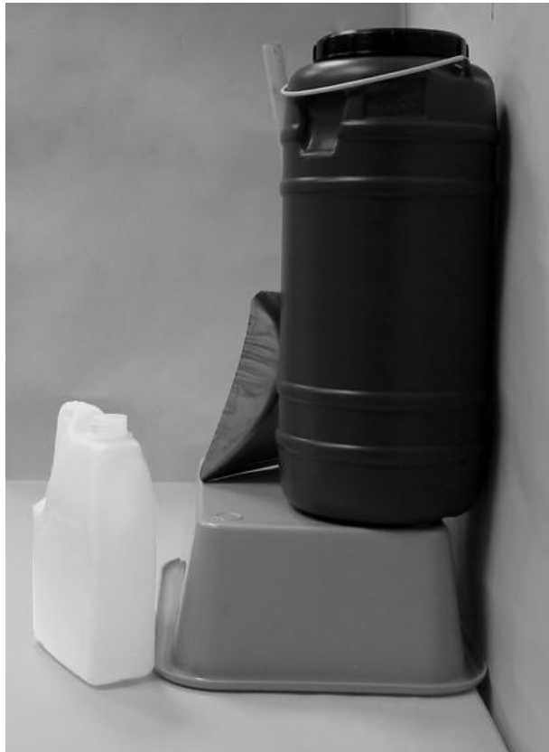
Τρίτη φωτογραφία: Πλάγια όψη