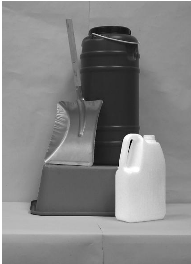
Πρώτη φωτογραφία: Μπροστινή όψη