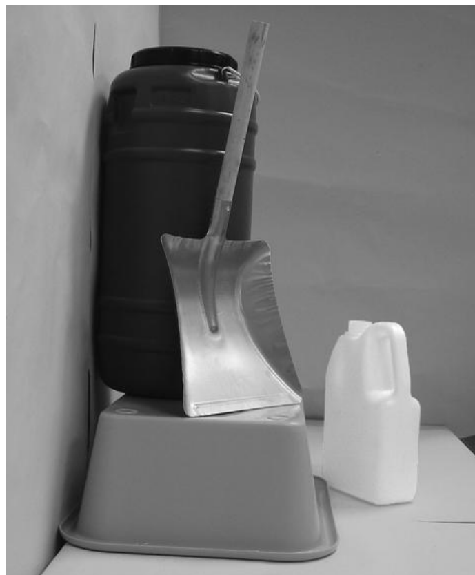
Τέταρτη φωτογραφία: Πλάγια όψη