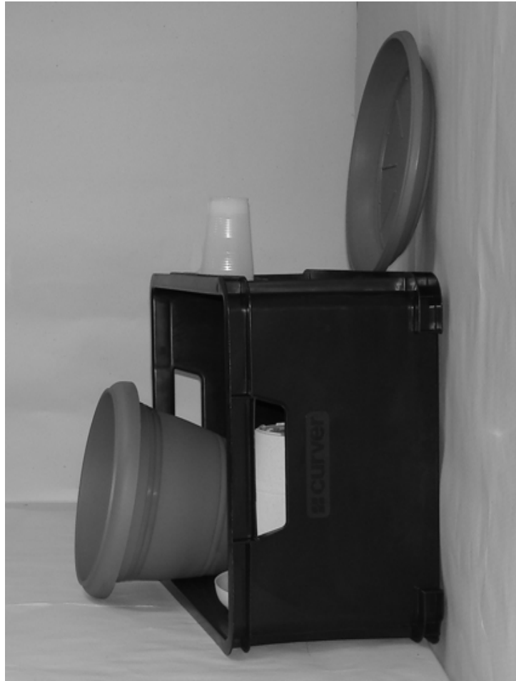
Τρίτη φωτογραφία : Πλάγια όψη