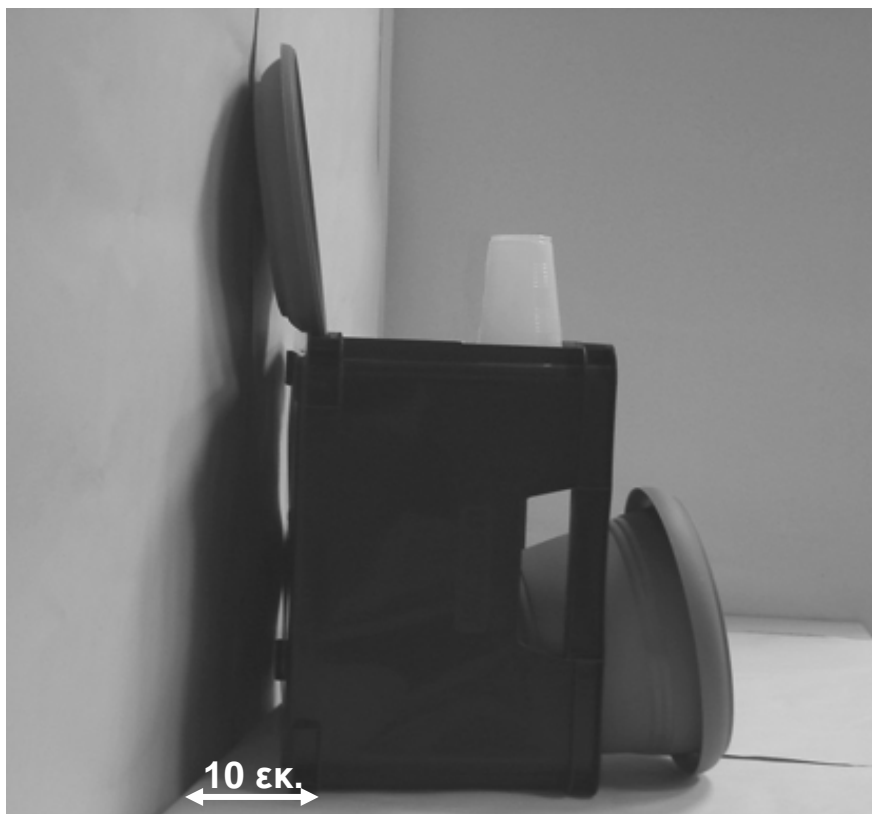
Τέταρτη φωτογραφία : Πλάγια όψη