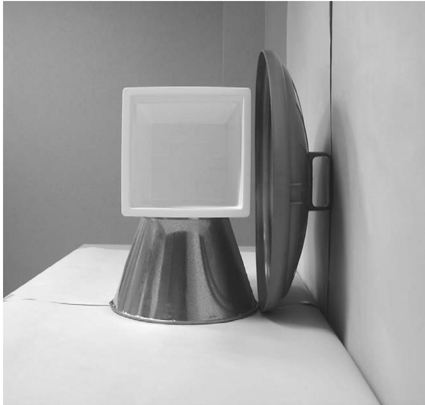
Τρίτη φωτογραφία : Πλάγια όψη