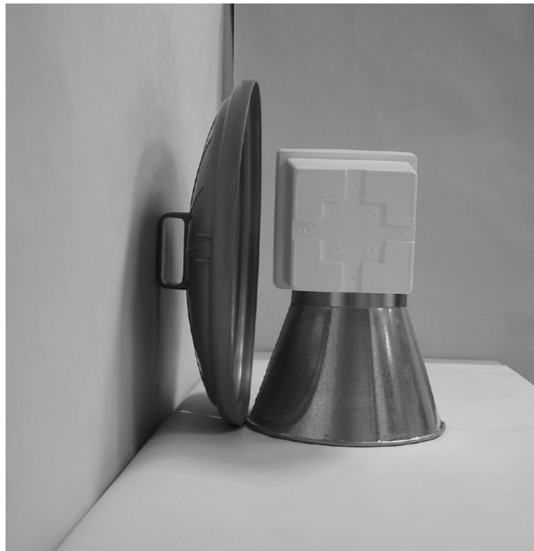
Τέταρτη φωτογραφία : Πλάγια όψη