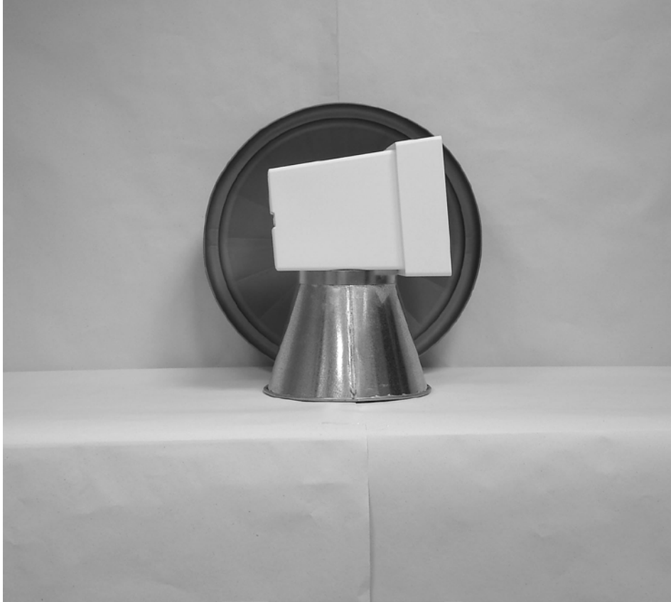
Πρώτη φωτογραφία : Μπροστινή όψη